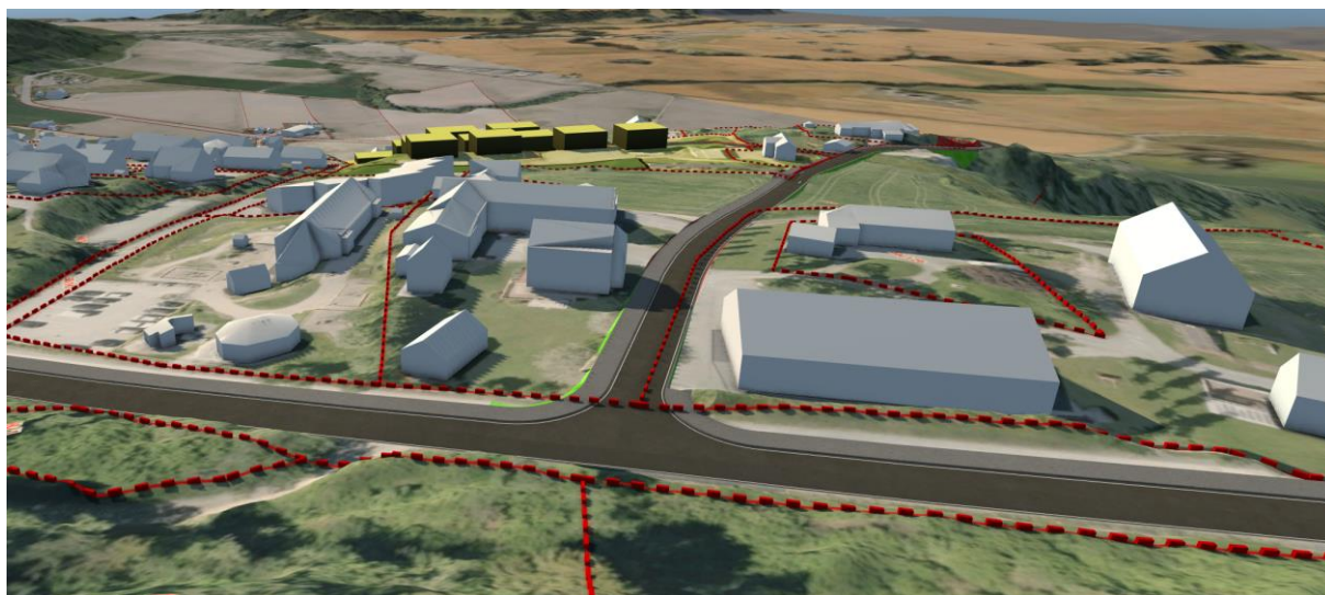
FIGUR 5: KONSEPTSKISSE FOR KRYSS VED LØVSETVEGEN