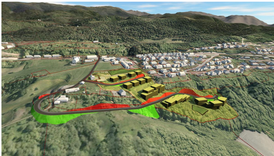
FIGUR 4: KONSEPTSKISSE FOR ADKOMSTVEG, SETT FRA NORDVEST