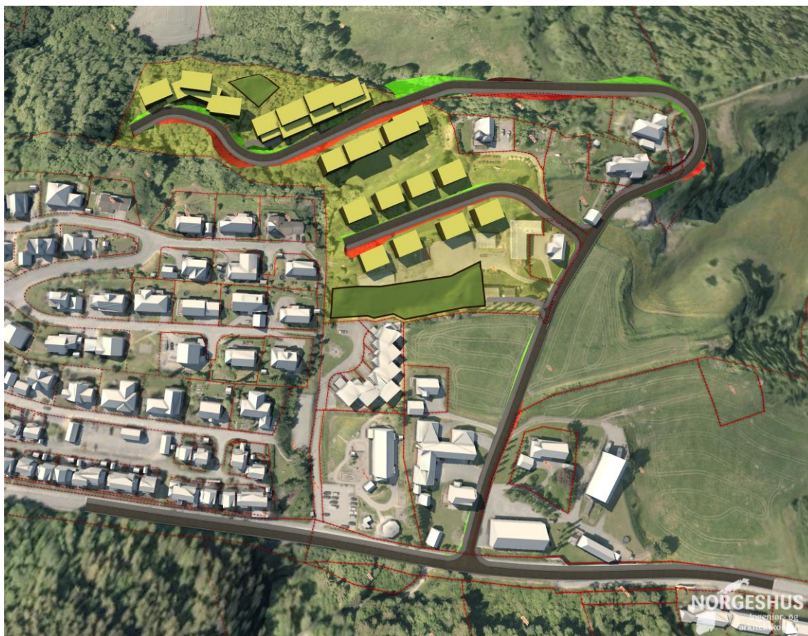
FIGUR 3: KONSEPTSKISSE FOR UTNYTTELSE